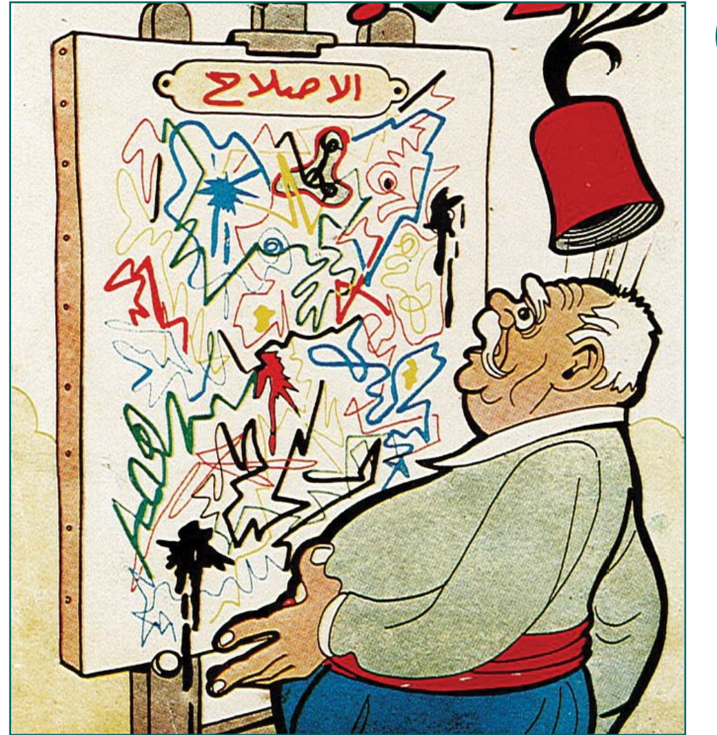
أحمد طوغان / مصر ©